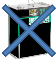
一度開封した混合油販売用容器等